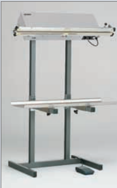
hpl 1000 AS hpl 1000 ST