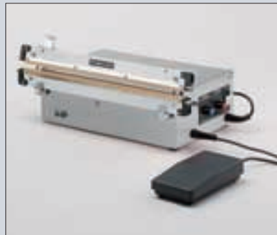
hpl 450 AS

Eine Leistungsangabe ist abhängig von Materialbeschaffenheit und Benutzerumfeld.